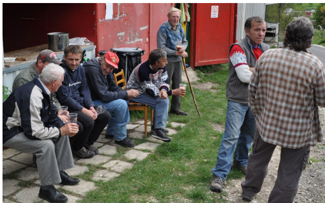
Členovia Dobrovoľného hasičského zboru v Bodinej zachovali aj tento rok tradíciu a na futbalovom ihrisku v piatok 16. septembra navarili pre svojich členov guláš.