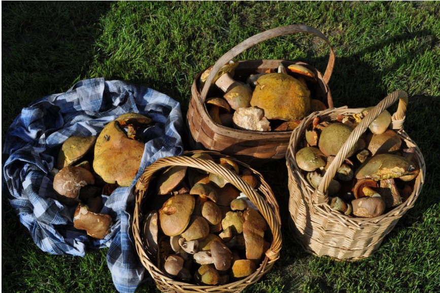
Tento rok bol pre hubárov štedrý...